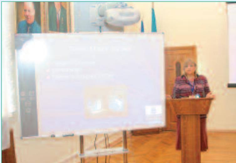
Закінчення. Початок на 4 стор.

Також використання нових технологій продемонструвала викладачка London School of