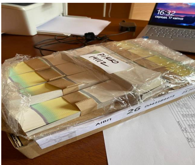
Рисунок 1.7 – Запаковані марки акцизного податку

Після всіх виконаних процедур, марки відправляють на підприємство щільно упакованими в коробки, зображено на рисунку 1.7