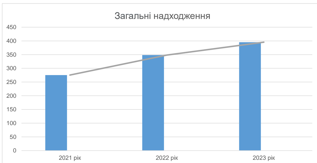
Рисунок 1.2 – Загальні надходження акцизного податку в Україні за 2021-2023 роки [16]

Надходження від акцизного податку в Україні протягом 2021-2023 років зросли на 43,6%. Найбільшу частку в надходженнях від акцизного податку протягом 2021-2023 років склали тютюнові вироби (34,5 %) , спирту етилового