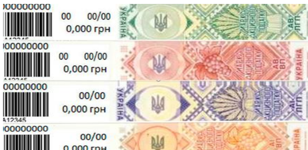
Рисунок 1.6 – Нові акцизні марки на алкоголь [15]

Існує два основних способи отримати акцизні марки в Україні. Перший спосіб, це придбання марок у ДП «Поліграфічний комбінат Україна по