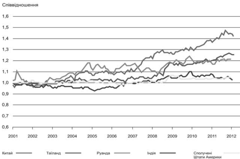
Рис. 2. Споживчі ціни на продовольство по відношенню до всіх цін по окремим країнам

Високі ціни на продовольство не стали, як виявилось, сприятливою можливістю для сільськогосподарських виробників країн, що розвиваються. Вони не скористалися цією можливістю для інвестування засобів, збільшення обсягу виробництва і підвищення продуктивності праці, оскільки ефект високих цін їх не досяг, їх доступ до фінансово прийнятних засобів виробництва був обмежений, в їх розпорядженні були лише слабкі технології, були відсутні необхідна інфраструктура і інституціональна база, а деякі заходи політичного реагування (наприклад, контроль цін і зниження тарифів) фактично скоротили стимули.