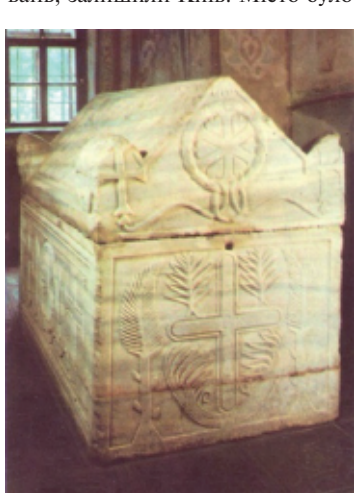
Саркофаг Ярослава Мудрого

«З наближенням фронту більшість громадських та церковних діячів, побоюючись переслідувань, залишили Київ. Місто було в руках військових частин, тож вхід біженцям туди був заборонений. Але це не стосувалося полковника німецької жандармерії, прізвище якого я не пам'ятаю, який повернувся у місто і вивіз на прохання єпископа Никанора його особисті речі, в тому числі ікону Миколи «Мокрого» та останки Ярослава Мудрого. Ешелон з біженцями вже від'їхав, але він реліквію не викинув, а довіз до Польщі і, не вдаючись у тонкощі церковної ієрархії, передав архієпископу Палладію, який очолював іншу православну церкву.