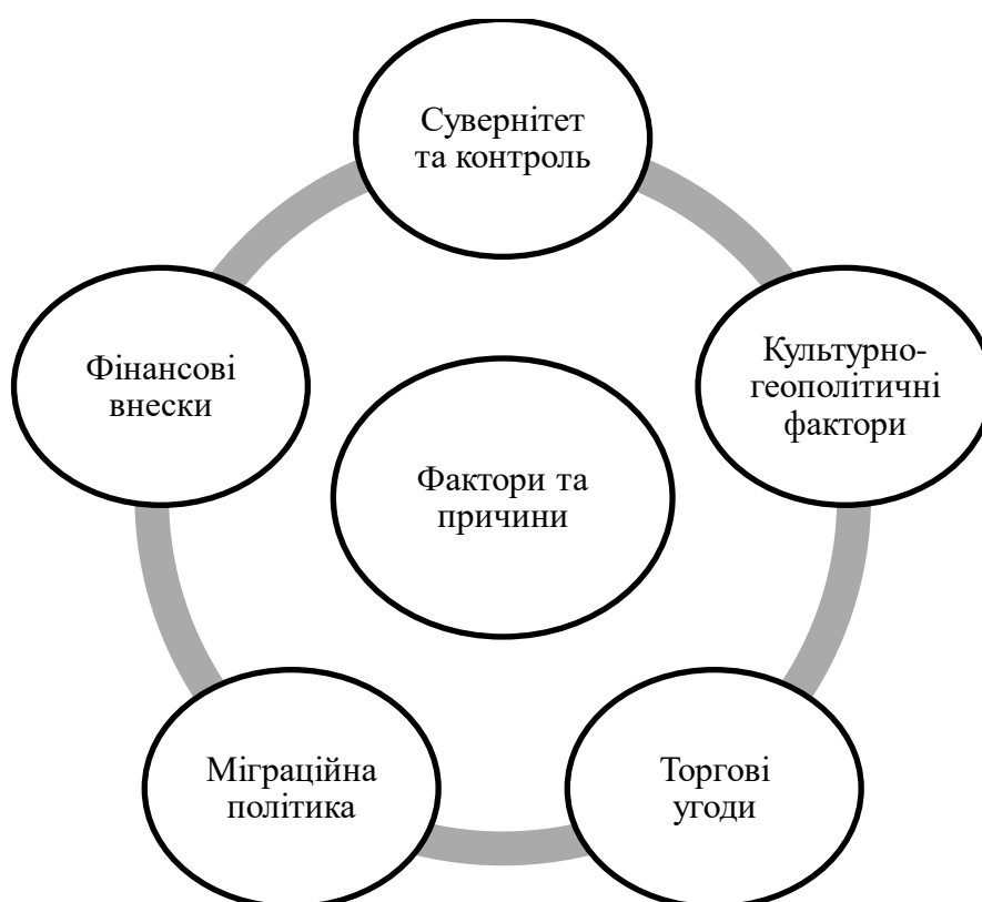
Рисунок 1.2 – Причини, що спонукали до розгляду питання про вихід Великої Британії з Євросоюзу

У недільній колонці газети «Telegraph» перед подіями 2016 року, було узагальнено причини, що спонукали до розгляду питання про вихід Великої Британії з Євросоюзу. Основні з них наступні наведені на рисунку 1.2.