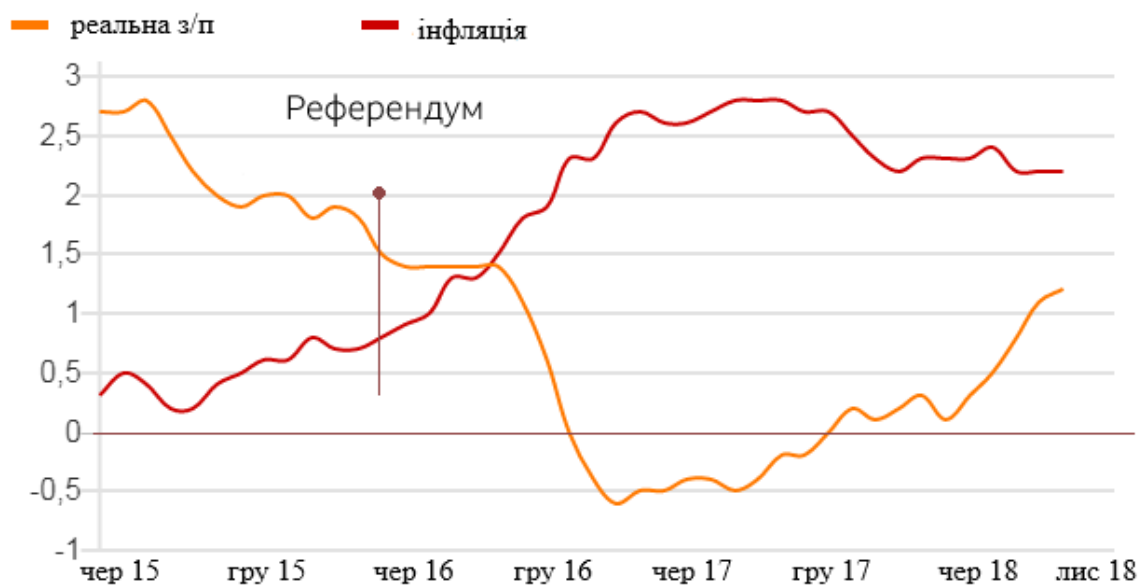
Рисунок 2.4 – Рівень інфляції та середньої реальної плати в Великобританії

Після референдуму зростання зарплат в реальному вираженні сповільнилося, а в 2017 році і зовсім змінилося спадом. Тільки до 2018 року воно почало відновлюватися завдяки відмові уряду від частини планів скорочувати і економити в бюджетному секторі (рис. 2.4).