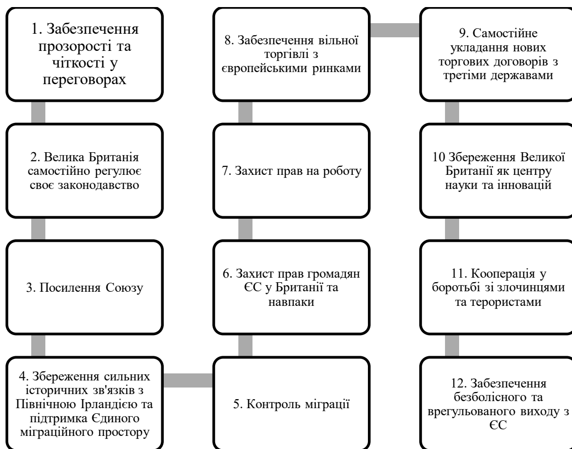
Рисунок 1.1 – Принципи ведення майбутніх переговорів щодо виходу Великобританії з ЄС запропоновані урядом Терези Мей

У лютому 2017 року був опублікований документ «Вихід Великої Британії та нове партнерство з Європейським Союзом» [17, с. 266]. Він нараховував 12 принципів (рис. 1.1.) і наступною фазою Brexit мали бути переговори про майбутні відносини між Лондоном і Брюсселем, якими вже буде керувати наступник Терези Мей.