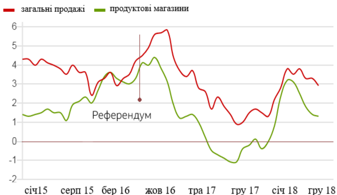
Рисунок 2.2 – Рівень продажів в Великобританії

Крім того, розглянемо наслідки Брексіту для ВБ. Темп зростання роздрібних продажів почав було збільшуватися перед референдумом, але голосування з невеликим лагом переламало цей тренд – в тому числі тому, що курс фунта різко обвалився, і роздріб відповів на це підвищенням цін (рис. 2.2).