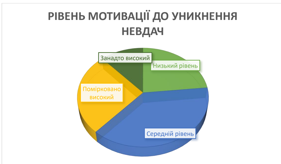
Діаграма рівнів мотивації до уникнення невдач по групі

Занадто високий рівень мотивації до уникнення невдач невелика група осіб. Ці люди можуть відчувати значний страх перед невдачами, що може значно обмежувати їхню активність і бажання брати на себе відповідальність. Вони можуть уникати навіть помірних ризиків, що може негативно впливати на їхній професійний та особистий розвиток.