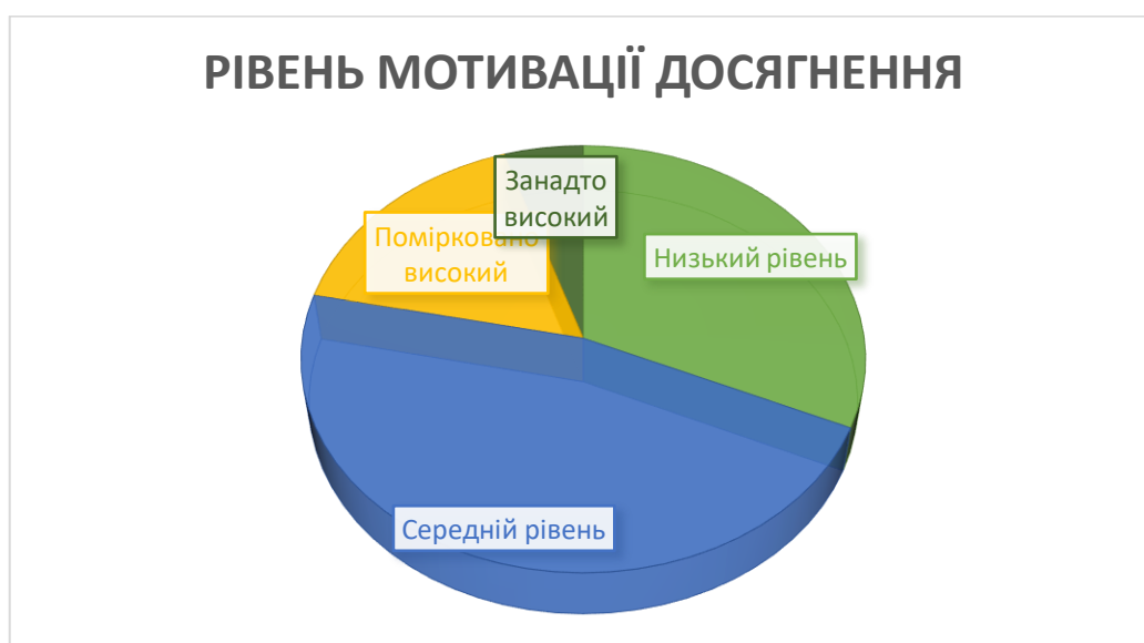
Діаграма рівнів мотивації досягнення по групі

Дуже невелика частина групи має надмірно високий рівень мотивації до успіху. Ці люди можуть бути надмірно амбітними, прагнучи досягти успіху будь-якою ціною. Вони можуть відчувати постійний стрес через необхідність досягати високих результатів, що може впливати на їхнє психологічне здоров'я.