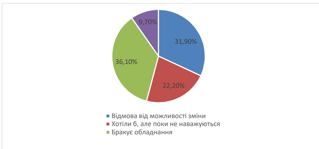
Рис. 2. Причини відмови від переорієнтації переробних підприємств під час війни

Ефективним інструментом управління, який здатен допомогти вистояти підприємству в умовах війни є також і переорієнтація (зміни в асортименті продукції) виробництва. Позитивним чинником розвитку переробного підприємства може в цей час стати виробництво продукції для потреб армії. Серед основного кола проблем, які охоплюють відмову від змін в асортименті або переорієнтацію підприємств, є: брак відповідного обладнання (36,1 %), брак технологій, знань, недостатня кваліфікація персоналу, недостатнє фінансове підґрунтя (рис. 2). У даній ситуації для забезпечення вводу додаткової продукції необхідним інструментом забезпечення ефективного управління роботою переробного підприємства може бути залучення зовнішніх інвестицій (як державних, так і іноземних інвесторів) та участь у державних програмах підтримки виробництва.