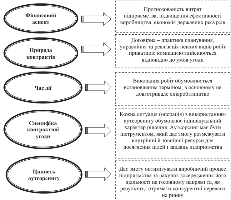
Рис. 1.1. Особливості використання аутсорсингу в бізнесі

Висновки з проведеного дослідження. Підсумовуючи, можна констатувати вельми складну економіко-правову та організаційну природу аутсорсингових відносин в країні. Зарубіжний досвід показує, що застосування аутсорсингу для суб'єктів господарювання дозволяє збільшити гнуч-