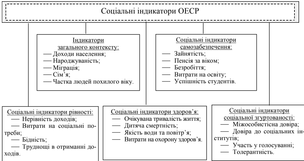
Рис. 2. Узагальнена структура системи основних соціальних індикаторів ОЕСР

У першому підході індикатори соціальної згуртованості суспільства інтегровані у загальну систему соціальних індикаторів ОЕСР (рис. 2).