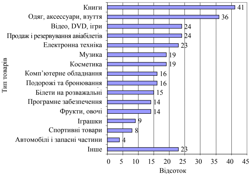
Рис. 3. Відносна кількість Інтернет-користувачів, що здійснюють покупки через Інтернет (% за типами товарів) [7]

електроприлади — 23 %). Кількість Інтернет користувачів, що купують книги онлайн, за останні 2 роки зросла на 7 %, але найбільшого росту зазнала торгівля одягом/аксесуарами та взуттям, у якій кількість покупців зросла з 20 % до 36 %. Вперше за всю історію існування Інтернет через нього було куплено більше одягу, ніж комп'ютерів і програмного забезпечення. Найбільшими покупцями книг в Інтернет є країни, що розвиваються, — Китай, Бразилія, В'єтнам та Єгипет. До найпопулярніших послуг у Інтернеті відносяться бронювання білетів, готелів та подорожі. На рис. 3 представлено розподіл Інтернет-користувачів за типами товарів та послуг, що вони купували онлайн у 2008 р. [7].