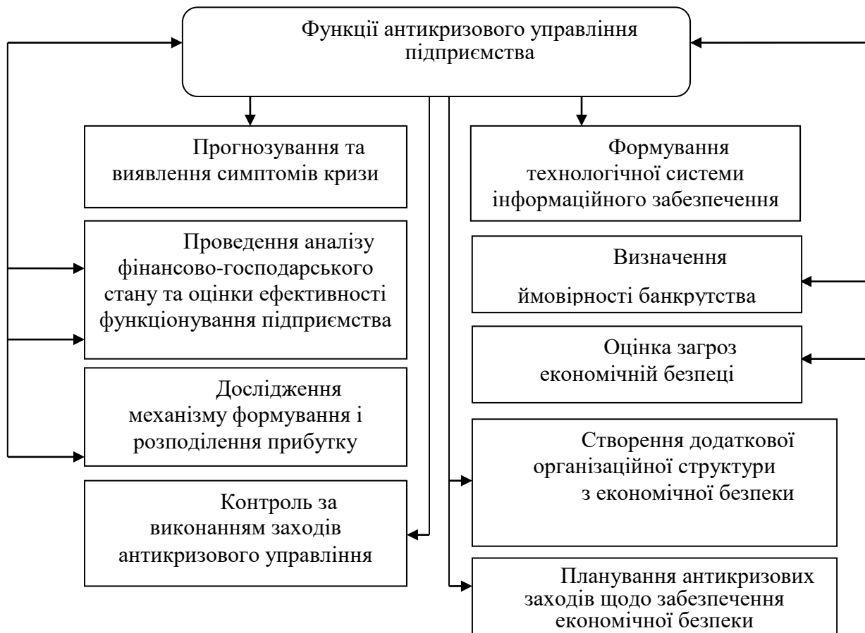
Рис. 2. Функції антикризового управління підприємства [складено авторами на основі [5]]

Тож, антикризове управління на підприємстві виступає важливим механізмом в умовах глобалізації кризових процесів, а також прийнятті управлінських рішень за наявності обмеженого числа ресурсів. Уміння швидко пристосовуватися до істотних і різких економічних змін, здатність ефективно розподіляти фінансові ресурси, спроможність виявляти місця локалізації кризи та вчасно запобігати подальшому її розповсюдженню, а також наявність певного комплексного антикризового інструментарію, дозволять забезпечити належного рівня економічну безпеку підприємству.