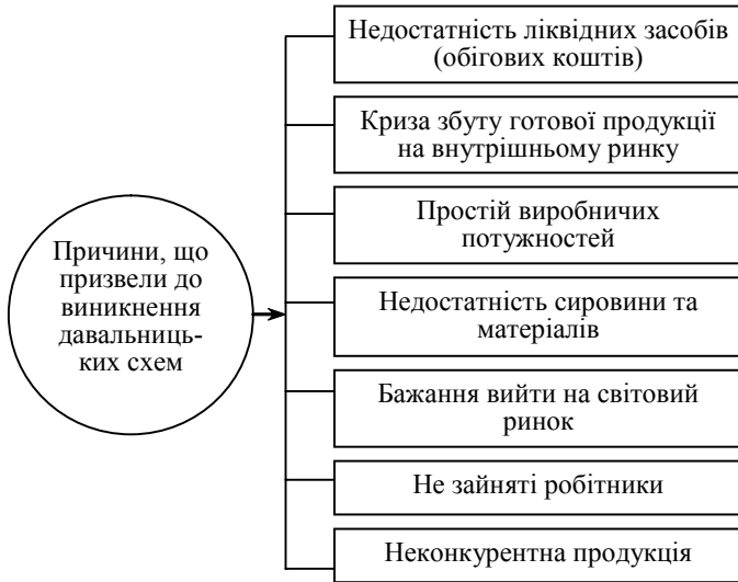
Рис. 2. Причини, що призвели до виникнення операцій з давальницькою сировиною

Причинами, які зумовили використання українськими підприємствами подібних схем, були наступні (рис. 2).