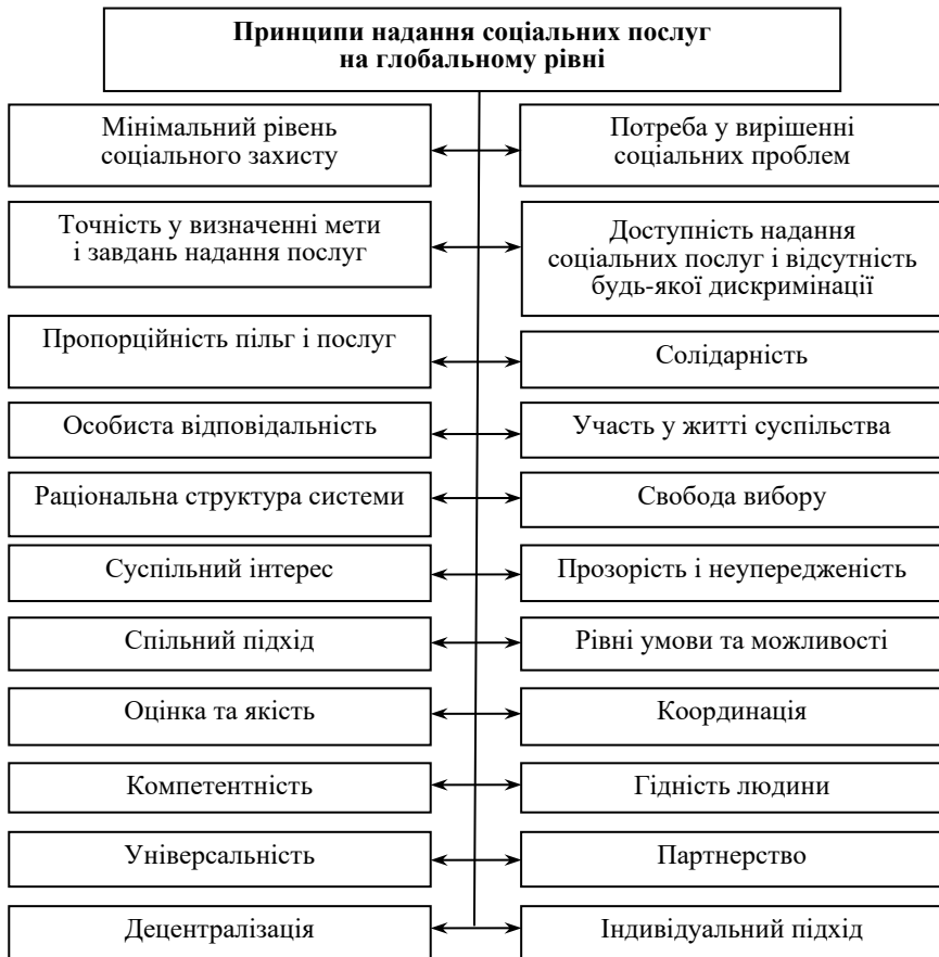
Рис. 1. Принципи надання соціальних послуг на глобальному рівні

рення до самостійної життєдіяльності, а також стимулює збільшення потоків нелегальних мігрантів із країн, що мають низький рівень економічного і соціального розвитку;