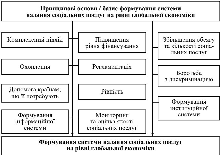
Рис. 3. Принципові основи / базис формування системи надання соціальних послуг на рівні глобальної економіки

Принципові основи формування системи соціальних послуг на рівні глобальної економіки виступають підґрунтям систем соціальних послуг на рівні національних економік і мають стратегічний вплив на забезпечення соціального захисту населення світу (рис. 3).