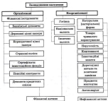
Рис. 2. Організовані та неорганізовані форми розміщення інвестицій

відомості 1 . За результатами систематизації наявних форм розміщення інвестицій проведено їх узагальнену класифікацію (рис. 2).