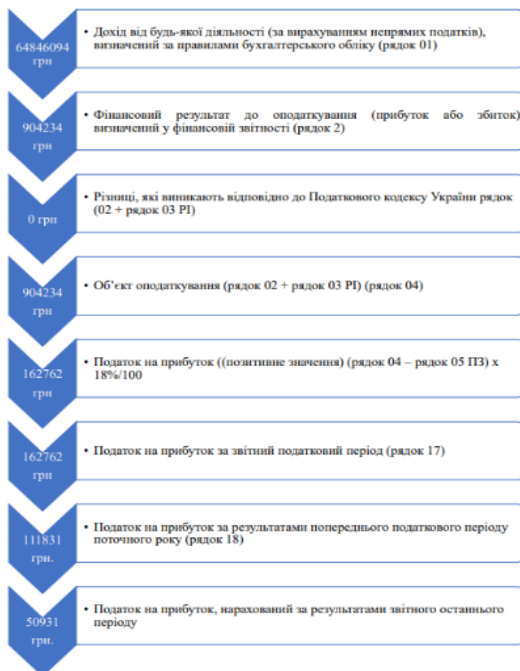
Рисунок 2.4 - Розрахунок податку на прибуток ТОВ «ЕБМ ПАПІСТ»

податок на прибуток, нарахований за результатами звітнього останнього періоду - 50931 грн. Алгоритм розрахунку податку на прибуток для підприємства показано на рис.2.4.