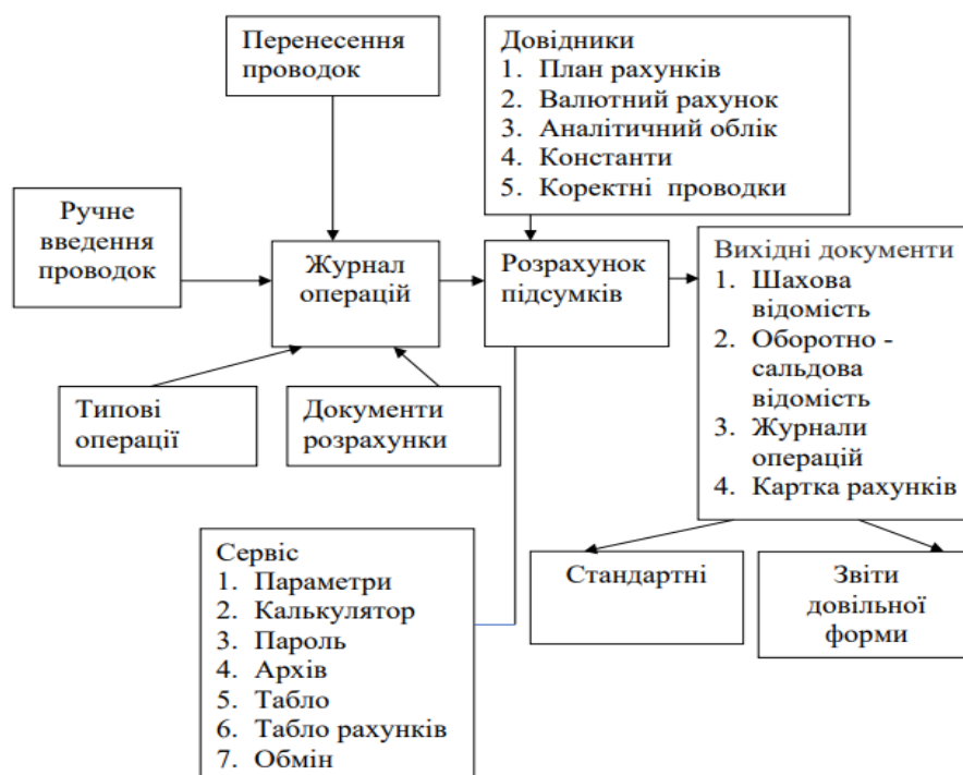
Рисунок 2.2 - Технологія побудови обліку на ТОВ «ЕБМ ПАПСТ»

проведеного дослідження можна зробити висновок, що мету введення ПКУ не досягнуто. Слід відзначити, що ліквідовано значну кількість відмінностей у правилах ведення бухгалтерського і податкового обліків, однак залишаються проблеми, які потребують подальшого вирішення. Зокрема, застосування НП(С)БО № 17 «Податок на прибуток» та НП(С)БО № 35 «Податкові різниці» є досить проблематичним, оскільки їх деякі норми не узгоджені. Крім того, необхідно розробити методичні рекомендації щодо застосування НП(С)БО № 35 «Податкові різниці». Потребує подальшого вдосконалення процес формування інформації про податкові різниці у регістрах бухгалтерського обліку. При відображенні інформації про суму нарахованого податку на прибуток та податкові різниці необхідно розкривати інформацію про узгодження (приведення) фінансового результату та податкового прибутку (збитку). Реформування податкового законодавства повинно відбуватись шляхом утворення більш досконалої податкової системи, 2 яка б задовольняла інтереси як держави, так і підприємців. Технологія побудови обліку на ТОВ «ЕБМ ПАПСТ» у програмі «1С-Бухгалтерія» представлена на рис.2.2.