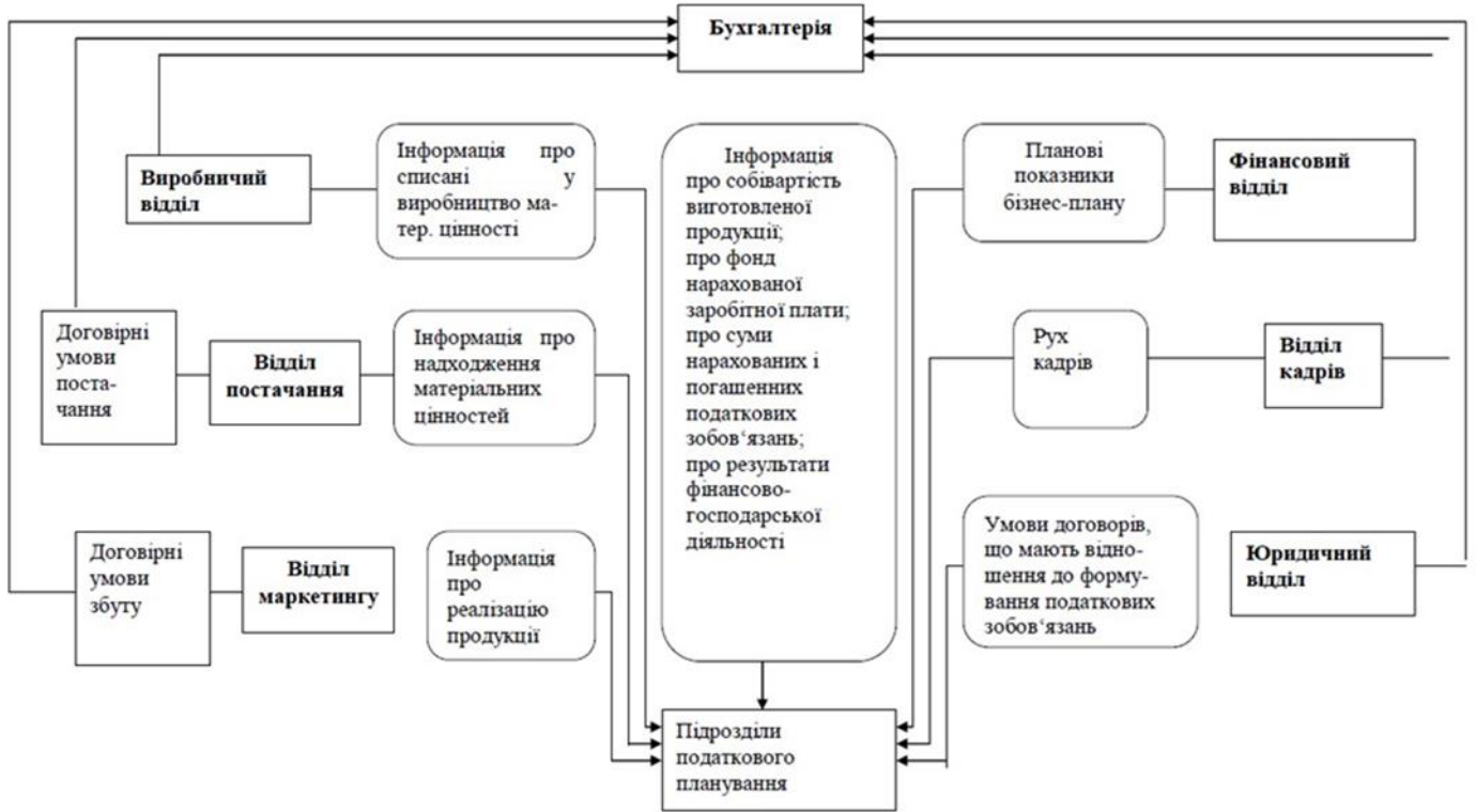
Схема податкового планування ТОВ "ЕБМ-ПАПСТ "