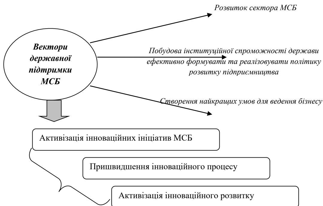
Рис. 2. Вектори державної підтримки інноваційних ініціатив МСБ*

В контексті стратегії розвитку малого і середнього підприємництва в Україні на період до 2020 року, державна підтримка інноваційного розвитку МСБ планується у межах трьох ключових векторів (рис. 2).