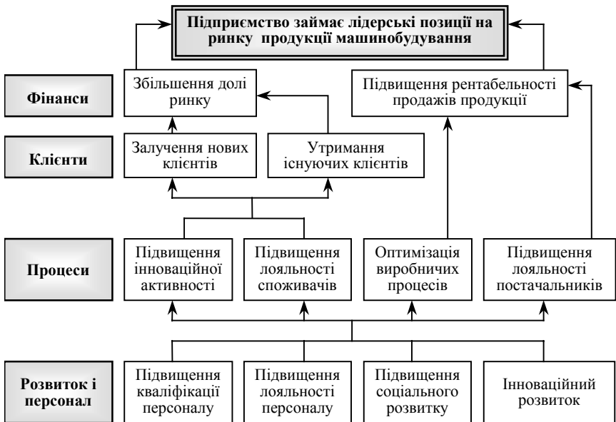
Рис. 2. Стратегічна карта підприємства машинобудування

Для підприємств машинобудування у якості стратегічних цілей можна виділити: лідерство підприємства з продажу продукції на регіональному чи національному рівні; максимізація прибутку; підвищення вартості підприємства і т.п. Якщо взяти за стратегічну ціль лідерство підприємства на ринку машинобудівної продукції, то стратегічну карту можна представити наступним чином (рис. 2).