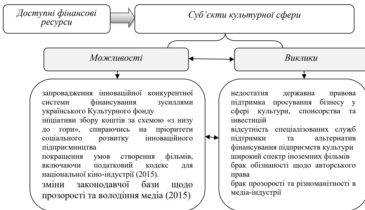
Рис. 2. Можливості та виклики посилення доступу до джерел фінансування суб'єктів культурної сфери в Україні

З огляду на наведену вище динаміку, можемо стверджувати про досить рівномірне фінансове забезпечення культурної компоненти людського розвитку, що, однак, не забезпечує належний обсяг такого фінансового забезпечення. В аналітичних записках європейських аналітиків визначаються можливості та виклики, які стосуються доступу суб'єктів культурної сфери в Україні до фінансування та інших форм підтримки (рис. 2).