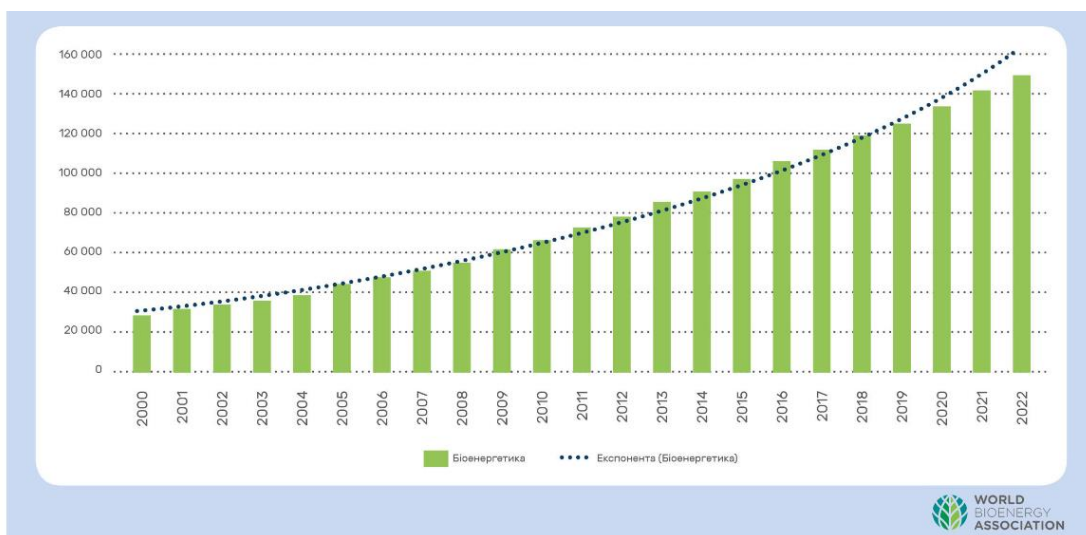
Рисунок 3.2 Потужність електрогенерації з біомаси у світі, МВт