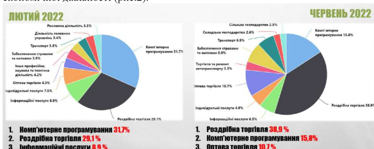
Рис.2 ТОП КВЕДів за кількістю реєстрацій ФОП України

На фоні активізації ФОП відбулася і структурна трансформація видів їх економічної діяльності (рис.2).