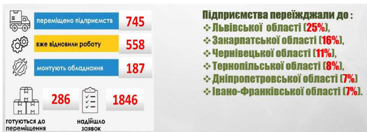
Рис.3 Результати програми «Релокація бізнесу» в Україні станом на вересень 2022 року

Від початку дії програми «Релокація бізнесу» зареєстровано вже 1846 заявок, 745 підприємств вже переїхали у більш безпечні регіони, 558 - відновили роботу на нових місцях, а для 286 підприємств зараз здійснюється пошук підходящої локації або способу транспортування (рис.3) [4].