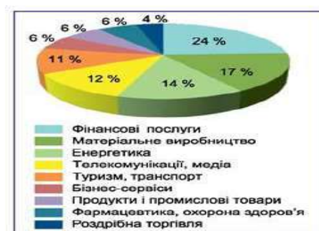
Рис. 1. Структура світового ІТ-аутсорсингу за видами діяльності[1]

Основною сферою глобального ІТ-аутсорсингу є фінансові послуги (майже четвертина контрактів) (рис. 1)[1].