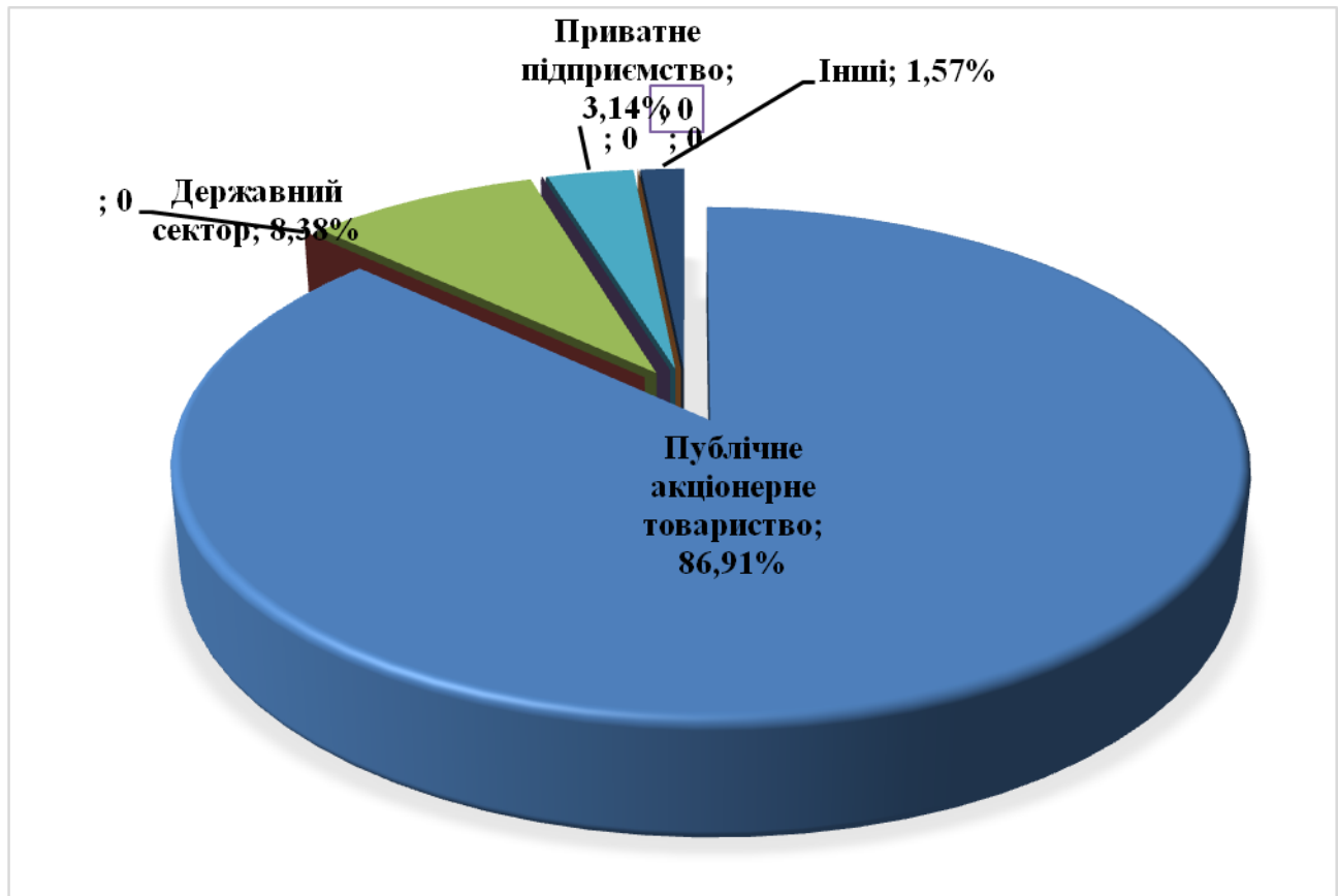
Рис. 1. Розподіл підприємств, що складають інтегровану звітність за <IRF> [1] за організаційно-правовими формами, (%)

Аналізуючи розподіл підприємств за організаційно-правовими формами можна сказати, що абсолютним лідером щодо складання інтегрованої звітності є публічні акціонерні товариства (86,91 %), на другому місці знаходиться державний сектор (8,38 %), третє місце займають приватні підприємства (3,14 %). Інші види організаційно-правових форм складають інтегровану звітність вкрай рідко (1,57 %).