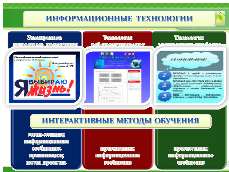
Рис. 1. Интеграция интерактивных методов обучения и инновационных технологий концепции формирования ЗОЖ студентов в процессе физического воспитания [6]

Полученные результаты теоретического обзора данных научных разработок и практических направлений использования информационных технологий в образовательном процессе помогли специалисту [7] определить механизм применения технологии веб-проектирования для создания внешнего сетевого ресурса – образовательный веб-портал «Здоровый образ жизни», который согласно своему содержанию включал систематизированные теоретические сведения о ЗОЖ, его пользе, преимуществах и мотивационной составляющей, комплексами физических упражнений, направленных на укрепление здоровья (рис. 2).