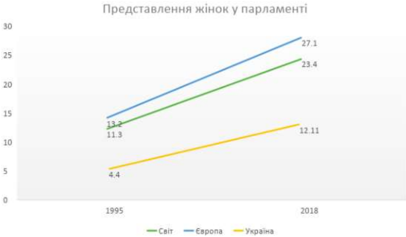
Рис. 3. Представлення жінок у парламентах України, Європи та світу

Здійснюючи моніторинг представлення жінок у чоловіків у парламенті, потрібно звернути увагу не тільки на депутатський корпус, але й на працівників Апарату Верховної Ради України, які є державними службовцями та працюють у парламенті постійно, незалежно від результатів виборів. Працівники Апарату керуються законом України «Про державну службу», в якому (ст. 4) закріплено право на забезпечення рівного доступу до державної служби — заборона всіх форм і проявів дискримінації, відсутність необґрунтованих обмежень або надання необґрунтованих переваг певним категоріям громадян під час вступу на державну службу та її проходження. Проте моніторинг офіційного сайту Верховної Ради України показує дещо іншу картину. Керівник Апарату ВРУ, два його перші заступники та три заступники — чоловіки. Також чоловіки очолюють 13 підрозділів Апарату ВР, серед яких переважно головні управління. Жінки очолюють 6 підрозділів, серед яких секретаріати керівництва Верховної Ради України, прес-служба, відділ з питань звернень громадян та контролю Апарату ВРУ. В секретаріатах парламентських комітетів ситуація з гендерною рівністю гірша, ніж у самих комітетах — серед очільників секретаріатів 13 жінок та 16 чоловіків.