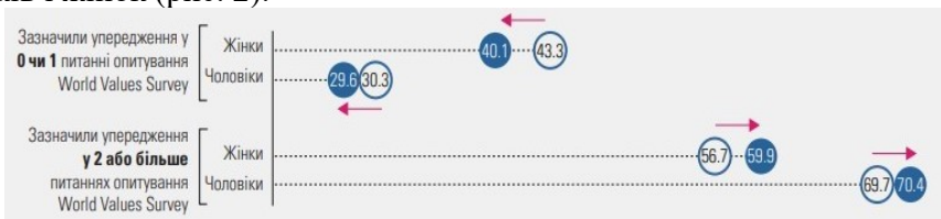
Рис. 2. Упередження щодо гендерної рівності 2010—2014 рр. 2015—2019 рр.

Всесвітнє дослідження цінностей — World Values Survey, проведене в 32 країнах (59 % населення світу), засвідчило зростання кількості осіб з гендерними упередженнями серед чоловіків і жінок (рис. 2).