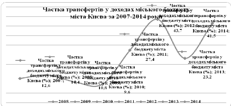
Рис. 1. Частка трансфертів у доходах міського бюджету міста Києва.

Питома частка трансфертів у доходах міського бюджету м. Києва за період з 2007 по 2014 роки також не носить однозначний характер. Перш за все, варто зауважити, що даний показник відображає пряму фінансову залежність бюджету міста Києва від державного, в процесі виконання повноважень покладених на місьцевий виконавчий орган. Тобто, чим вища питома вага трансфертів у структурі бюджету міста Києва, тим вища його залежність від фінансових ресурсів, що перераховує держава. Тому можемо констатувати значну залежність у фінансуванні бюджету міста Києва у 2012 та 2014 роках, де питома вага трансфертних платежів склала більше 40,0 %. На рис. 1 наочно відображено тенденцію змін питомої ваги частки трансфертів у структурі доходів міських бюджетів, що ілюструє раніше проведений аналіз.