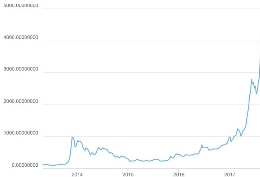
Рис. 3. Динаміка курсу біткоіна в 2014–2017 рр.

За умови використання криптовалюти перед менеджерами підприємства постає нова задача — відстеження змін у попиті та пропозиції електронних грошей, адже, як уже зазначалося, курс даної валюти залежить саме від їх взаємодії та постійно змінюється, зазнає як різких підйомів до рекордних значень, так і падінь до своїх мінімумів (рис. 3).