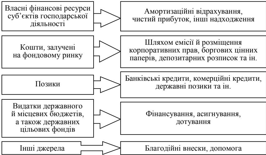
Рис. 2. Джерела фінансування інновацій (складено автором за даними [10])

ва харчової промисловості регіону зазнали збитків на суму 24983,7 тис. грн, а за 11 місяців 2011 р. — отримали збиток у сумі 10476,7 тис. грн. При цьому спостерігається негативна тенденція до збільшення частки збиткових підприємств: протягом січня — листопада 2011 року вона зросла до 53,7 % (у 2010-му — 40,0 %) [7].