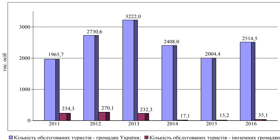
Рис. 2. Кількість обслужованих туристів в Україні у 2011-2016 рр.

Джерело: складено і побудовано автором за даними: [2]