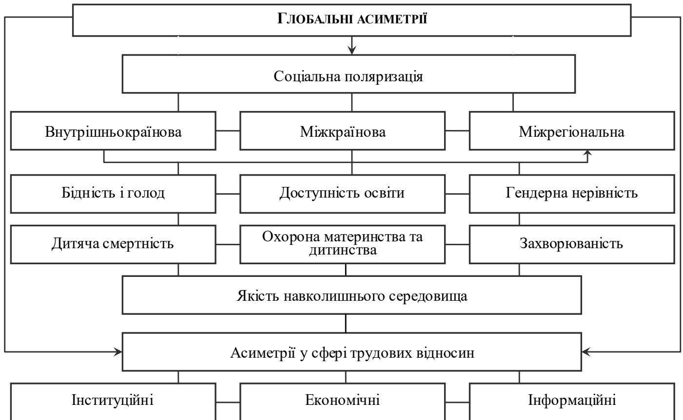
Рис. 2. Формат аналізу глобальних соціальних асиметрій