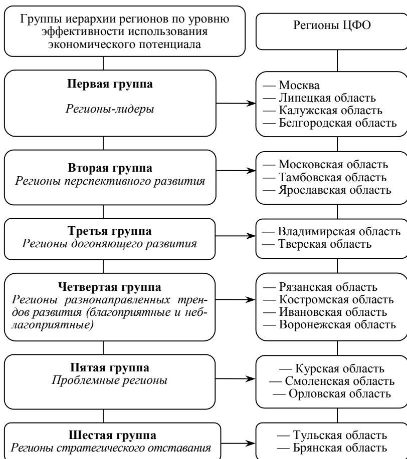
Рис. 3. Ранжирование регионов ЦФО по уровню эффективности использования экономического потенциала в 2007—2009 гг.

Как видно из рис. 3, к регионам-лидерам отнесены Белгородская, Липецкая, Калужская области, а также город Москва.