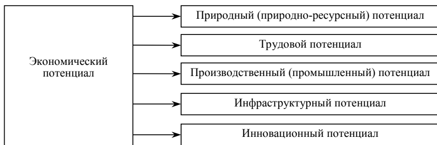
Рис. 1. Экономический потенциал региона

Экономический потенциал региона — это совокупность имеющихся в наличии и возможных для мобилизации ресурсов региона, необходимых для его развития при условии максимального использования имеющихся возможностей для производства конкурентоспособной продукции и наиболее полного удовлетворения потребностей нынешнего и будущего поколений, с учетом интересов государства и бизнеса [3]. Во многом он определяется уровнем развития межотраслевых и межтерриториальных связей (рис. 1).