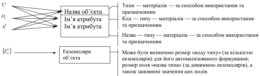
Рис. 2. Відображення таксономії у схему БД

значення», що включатиме код типу та назву типу. Відображення може бути представлено як на рис. 2.