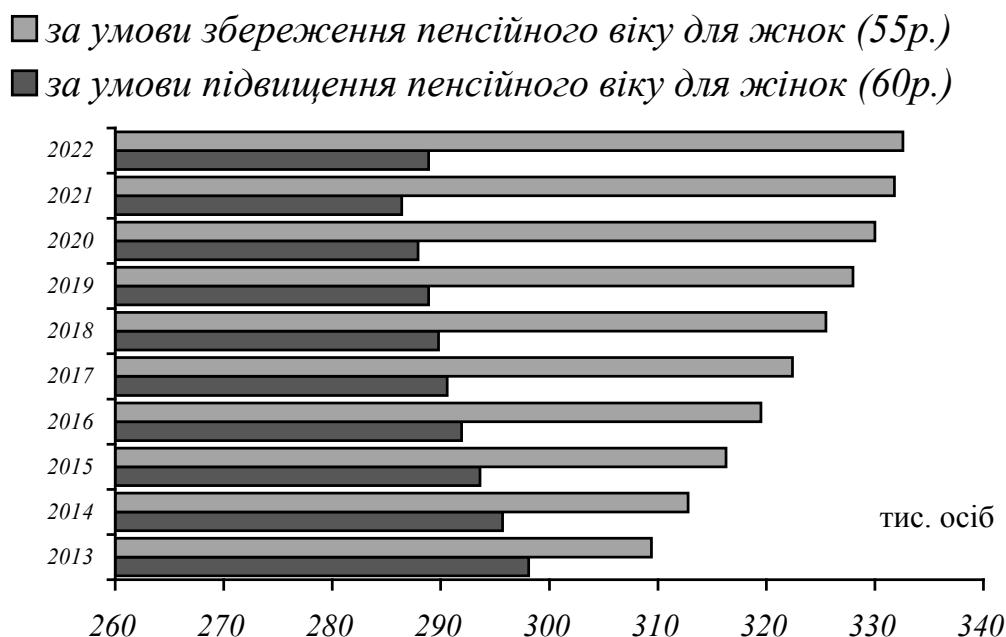
Рис. 2. Прогноз чисельності пенсіонерів при різних варіантах пенсійного віку для жінок

Прогнозна чисельність пенсіорів в регіоні є основою для планових розрахунків видаткової частини бюджету ПФ, який було побудовано за трьома альтернативними варіантами — песимістичним, оптимістичним та нормативним (табл. 3).