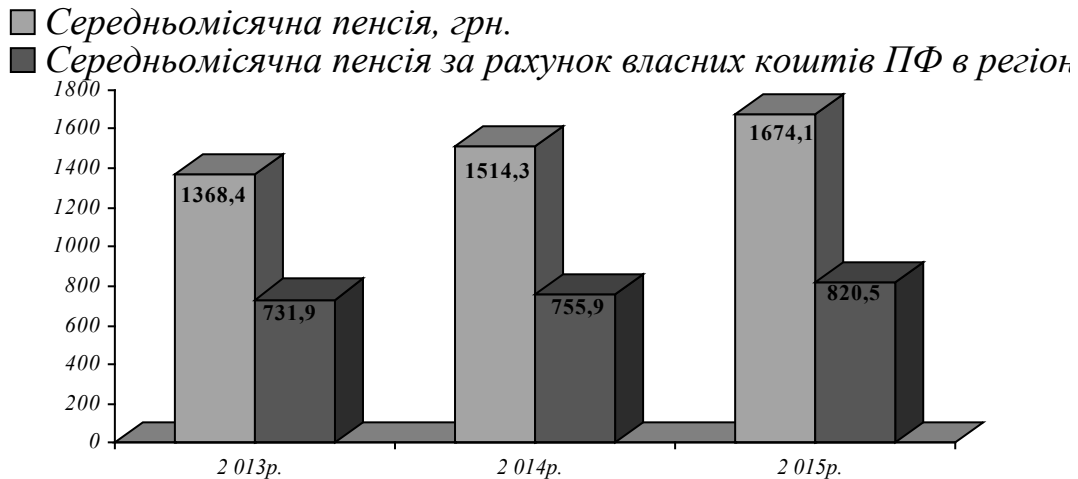
Рис. 4. Прогноз середньої пенсії в регіоні, 2013-2015рр.

Прогноз видатків і чисельності пенсіонерів є основою для прогнозних розрахунків середньої пенсії, яка в майбутньому щорічно зростатиме (рис. 4).