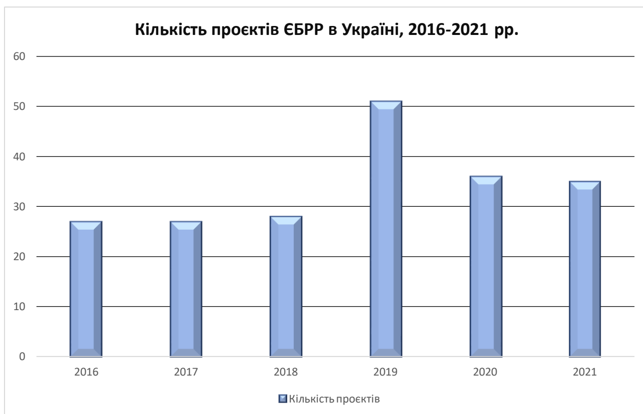
Рисунок 2.1. – Кількість проектів ЄБРР в Україні, 2016-2021рр.

Джерело: складено автором на основі даних [29]