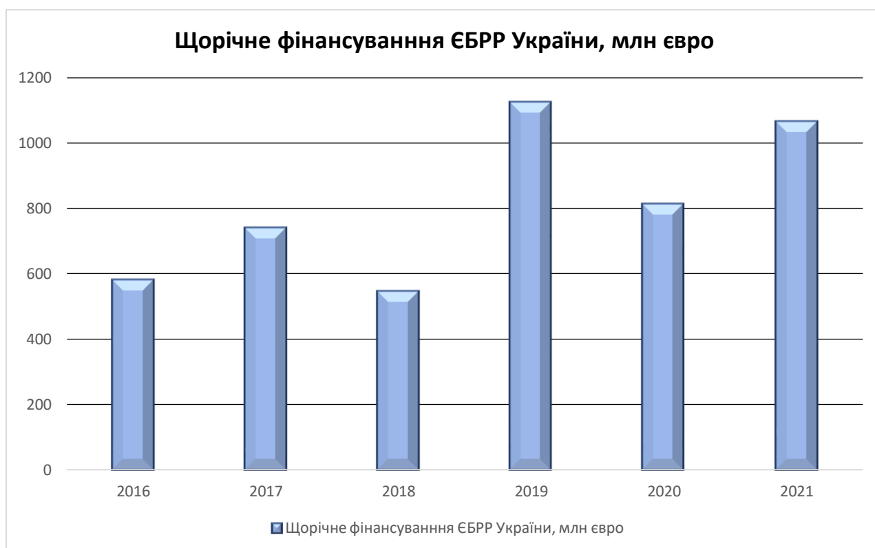
Рисунок 2.2. –Фінансування ЄБРР України, млн євро, 2016-2021.

Джерело: складено автором на основі даних [29]