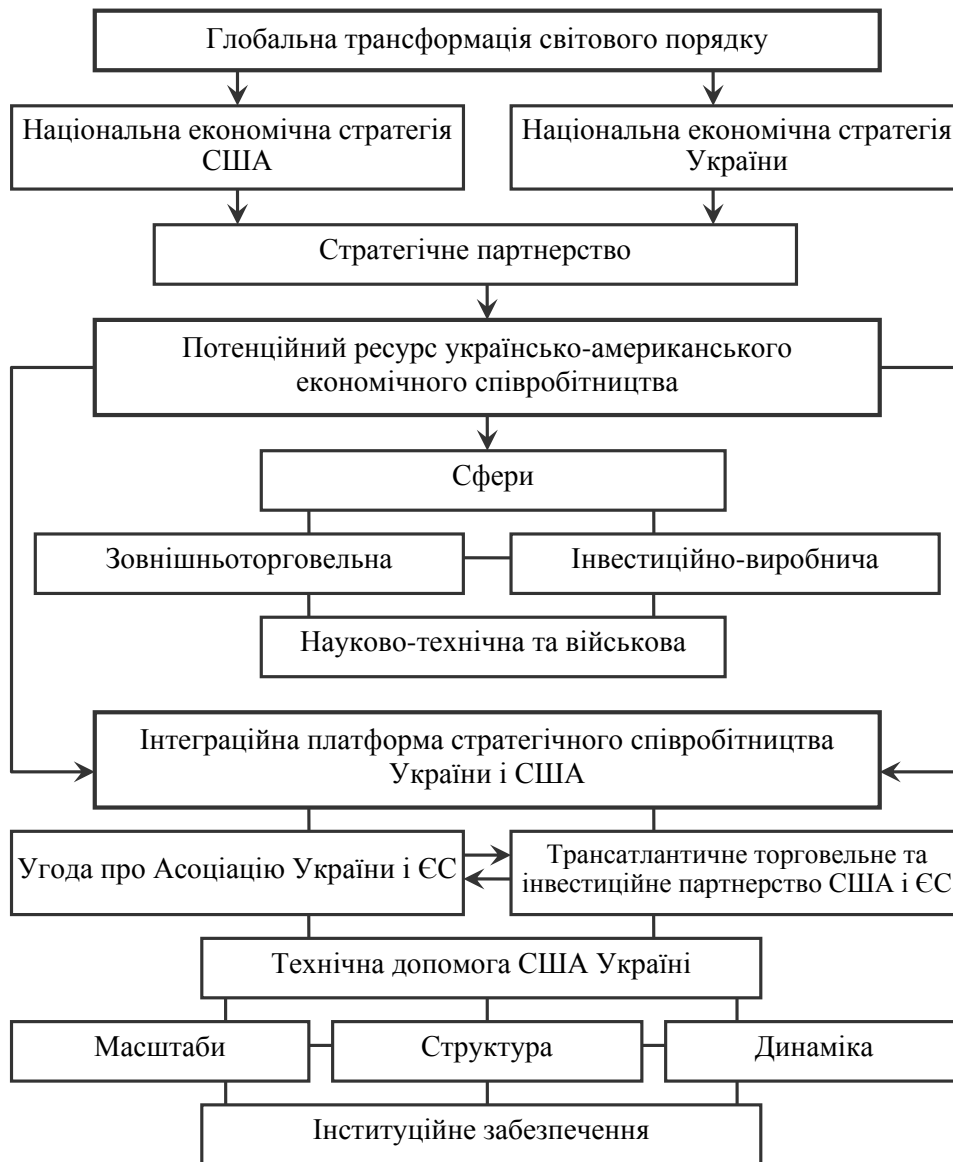
Рис. 1. Логіка дисертаційного дослідження

Для досягнення мети і розв'язання завдань дисертаційної роботи були використані наступні методи наукового дослідження економічного співробітництва України і США у форматі нового світопорядку: діалектичний метод (при дослідженні трансформаційних змін світового економічного порядку та обґрунтуванні парадигмальних засад формування його глобальної моделі: п. 1.1); історико-логічний метод (при дослідженні еволюції світового економічного порядку; характеристики етапів економічного співробітництва України і США у торговельній, інвестиційно-виробничій та науково-технічній сферах: пп. 1.1, 2.1, 2.2, 2.3, 3.2); системно-структурний аналіз економічних процесів та явищ (при характеристиці національної економічної стратегії України у глобальних координатах; дослідженні глобальних цілей США та економічних механізмів їх реалізації: пп. 1.2, 1.3); аналіз та синтез (при оцінці масштабів, структури і нереалізованого потенціалу торговельного, інвестиційно-виробничого та науково-технічного співробітництва України і США: пп. 2.1, 2.2, 2.3); метод кількісного та якісного порівнянь (при оцінці перспектив поглиблення економічного співробітництва України і США на інтеграційній платформі Угоди про асоціацію України з ЄС та ТТП; а також визначенні рівня міждержавної співпраці України і США за проектами міжнародної