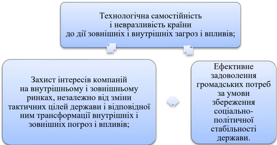
Рис. 1. Основні складові міжнародної економічної безпеки країн

Класифікувати особливості міжнародної економічної безпеки, за результатом сукупності глобальних трансформацій як всередині країни, так і вцілому у світовому господарстві, можна представити як систему чинників і процесів що наведені на рисунку 2.