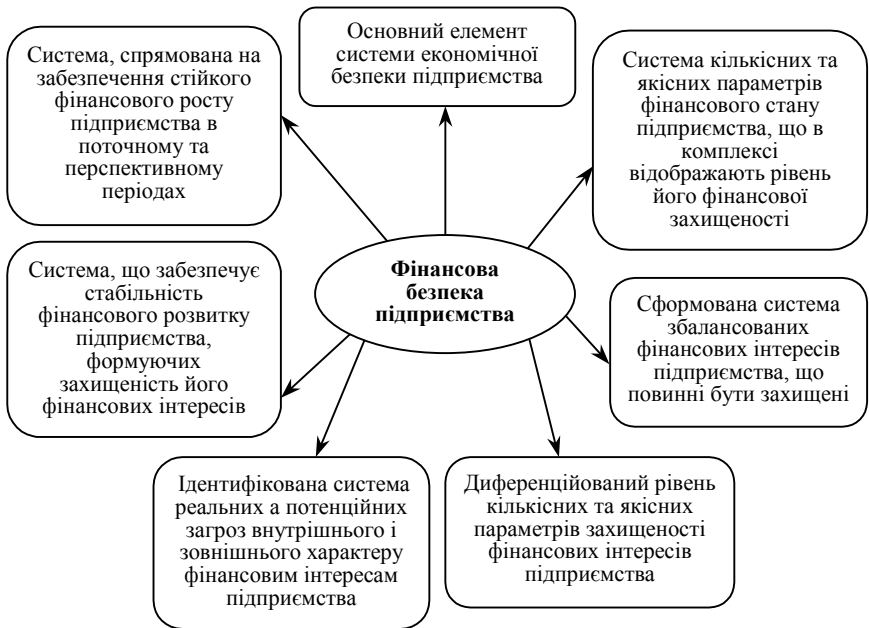
Рис. 1. Основні сутнісні характеристики фінансової безпеки підприємства як об'єкту управління [4]

Поняття «фінансова безпека підприємства» є синтезованим поняттям, яке інтегрує в собі сутнісні характеристики категорій «економічна безпека підприємства» і «фінанси підприємств». Ці категорії достатньо широко розглядаються в сучасній літературі, що дозволяє, на нашу думку, використовувати їх теоретичну базу під час дослідження сутнісних характеристик поняття «фінансова безпека підприємства» як самостійного об'єкту управління. І.А. Бланк [4] пропонує наступні істотні характеристики поняття «фінансова безпека підприємства» (рис. 1).