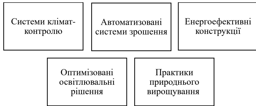
Рис. 1 – Компоненти «першого покоління» інновацій тепличної галузі [5]

Проте, постійна боротьба визначає сутність конкурентоспроможності, і її головна складова - інноваційна діяльність, також постійно розвивається. У тепличному господарстві зараз активно розробляються та впроваджуються інновації «другого покоління», які стали можливими, як вже зазначалося раніше, завдяки розвитку інновацій у інших галузях світової економіки, таких як робототехніка, штучний інтелект, дрони і системи обробки та управління великими базами даних (рис 2).