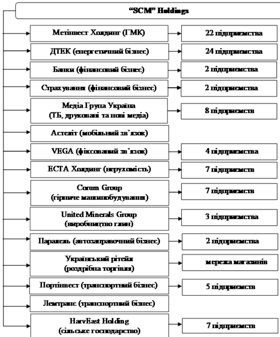
Рис. 1. Структура групи "СКМ"