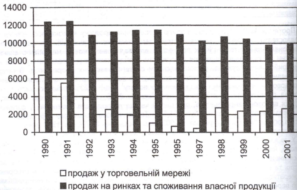
Рис. 2. Кількість проданого молока в торговельній мережі та спожитого і проданого на ринках та посередниками в Україні

Загальні обсяги реалізації молока у 2002 році порівняно із 2001-м зменшилися на 8,8%; на 2,2% зросла частка молока, реалізованого заготівельним організаціям; на 1,1% зменшилася частка молока, реалізованого населенню через систему громадського харчування та в рахунок оплати праці; зросла реалізація молока за бартерними угодами (на 1%). Це пояснюється зростанням закупівельних цін у системі заготівель, поліпшенням системи розрахунків між контрагентами. Так, у 2002 році товаровиробники молока реалізовували його переробним організаціям за ціною 554,8 грн./т, що на 2,6% більше середньої реалізаційної ціни за всіма каналами реалізації. Закупівельні ціни на молоко, яке реалізовували населенню через систему громадського харчування і в рахунок оплати праці, а також на молоко, яке реалізовували на ринку, були нижчі від середньої ціни на 11,7 і 3,8% відповідно. У 2002 році закупівельні ціни на молоко за всіма каналами реалізації почали різко знижуватися. На думку спеціалістів, це пов'язано із сезонністю виробництва, зменшенням рівнів збуту готових молочних продуктів як на внутрішньому так і на зовнішніх ринках.